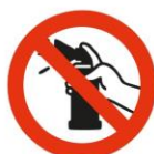
Buzinas de Ar Comprimido Claxons