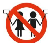
Selfie Sticks / Paus Sticks