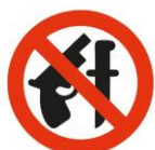
Armas Fogo / Brancas Guns and knives