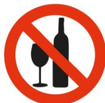
Garrafas / Copos Vidro Glasses and bottles

Qualquer pessoa que esteja na posse destes objetos será proibida de entrar no recinto.