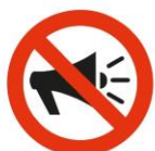
Megafone Loud speakers