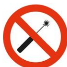
Apontadores Laser Lasers