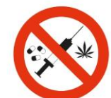
Drogas / Seringas Syringes

E outros objetos que ponham em causa a segurança do evento e dos participantes.