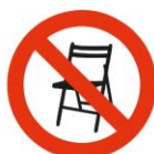
Bancos / Cadeiras Chairs