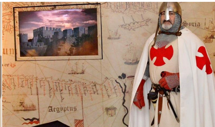
Figurino de Cruzado. Associação Companhia Livre. Marcação prévia. Reservation is required.