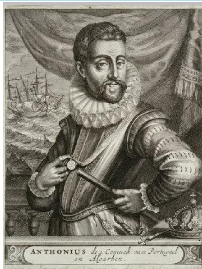
» D. António I, mostrando a medalha da Ordem de Aviz. Gravura flamenga, 1595. Museu Nacional Marítimo (Greenwich, Londres). » D. Anthonius I, showing the medal of the Order of Aviz. Flemish engraving, 1595. National Maritime Museum (Greenwich, London).

Após a morte do jovem monarca D. Sebastião na batalha de Alcácer Quibir (Norte de África), em agosto de 1578, e a do seu sucessor tio-avô, o Cardeal D. Henrique, em janeiro 1580 – ambos sem descendentes –, instala-se novamente uma crise na sucessão à coroa portuguesa e, conseqüentemente, a ameaça de uma guerra civil. Entre os candidatos estão os netos do Rei D. Manuel I: D. Filipe II de Espanha; D. António I, Pio do Crato (que havia sido resgatado do campo de batalha na qual D. Sebastião perdera a vida); e ainda D. Catarina, duquesa de Bragança. A disputa resvala num conflito militar entre os dois primeiros. Em junho de 1580, em Santarém, D. António I é aclamado rei pelos populares e por alguns nobres que receiam a perda da independência e que procuram o apoio em Lisboa e noutras cidades. Por sua vez, a nobreza, o clero e a burguesia que esperam privilégios e riqueza, ficam do lado de D. Filipe II. Apoiante deste, o duque de Alba assenta tropas em Setúbal a 16 de julho de 1580, antevendo-se a conquista da capital do reino que viria a ter como palco principal a ponte de Alcântara. As tropas de D. António são derrotadas, ficando aberto o caminho para os 60 anos da dinastia filipina.