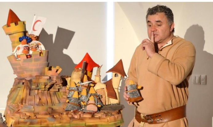
Afonso Henriques. Ntheias - Realizações e Artes Plásticas, Lda. Marcação prévia. Reservation is required.